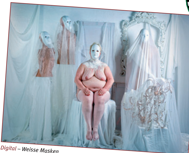
Digital – Weisse Masken