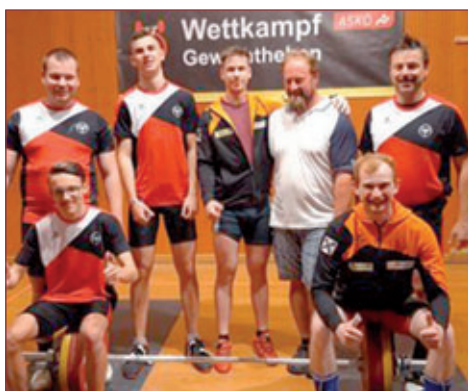
Mannschaft gegen Salzburg