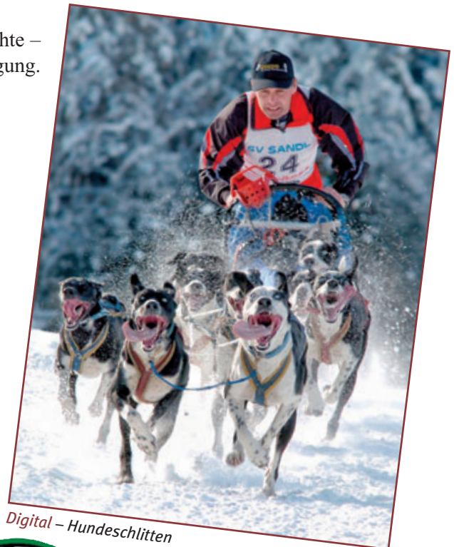
Digital – Hundeschlitten