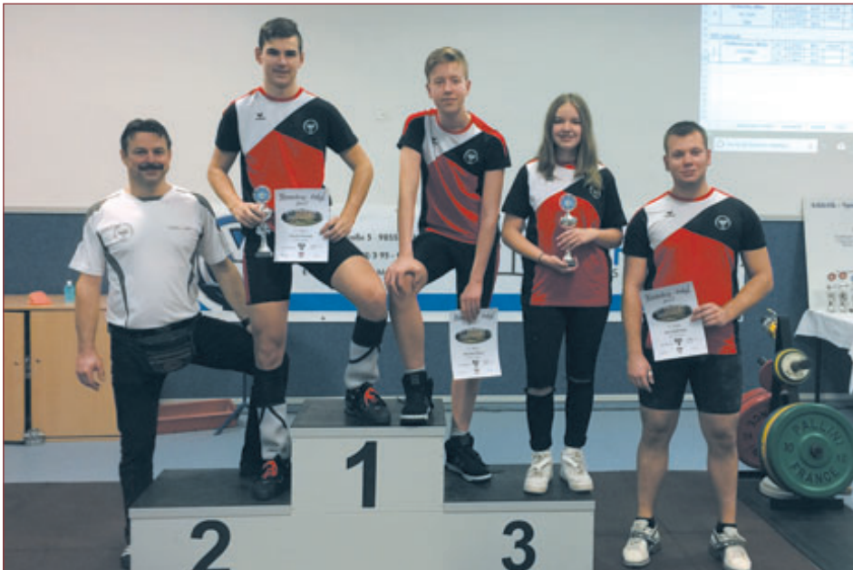
Starter vom Henneberg-Pokal in Deutschland