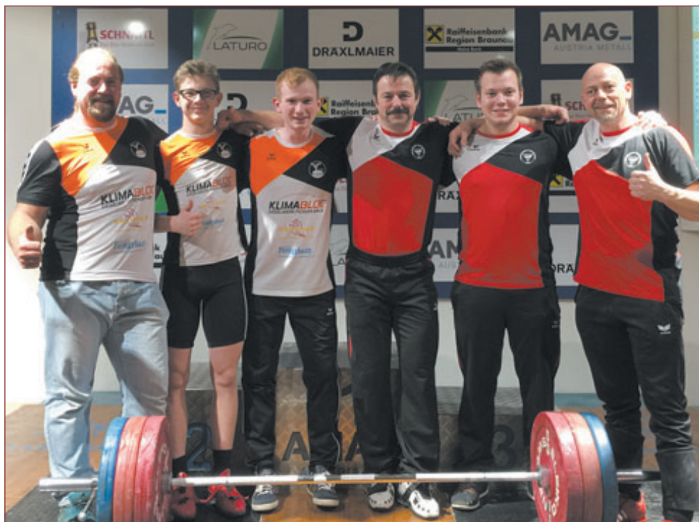
Mannschaft LL ÖÖ, 4. Platz

Unsere Trainingszeiten sind: Montag und Donnerstag von 18:00 - 20:00 Uhr