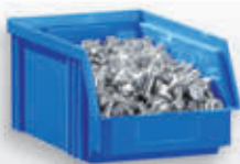
Lager & Betrieb