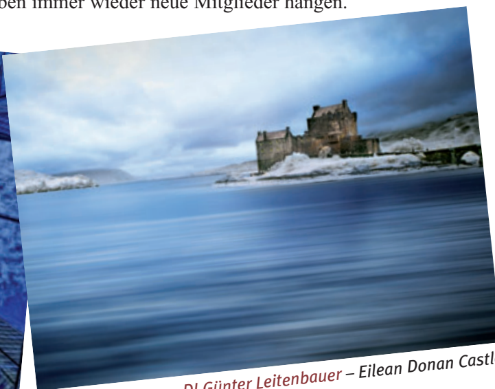
DI Günter Leitenbauer – Eilean Donan Castle

Mehrfache Staatsmeistertitel, Landesmeistertitel in der Clubwertung aber auch im Einzel zeigen den Status des Zweigvereins (seit 2004) im österreichischen Fotogeschehen.